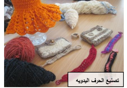
تصنيع الحرف اليدويه