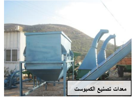
معدات تصنيع الكمبوست