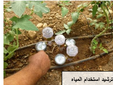
ترشيد استخدام المياه