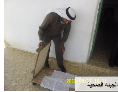
2011/06/17 10:11 الجنة الصحية