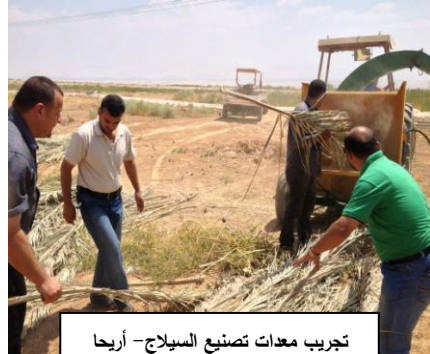
تجريب معدات تصنيع السبلاج - أريحا