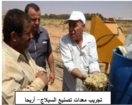
تجريب معدات تصنيع السبلاج - أريحا