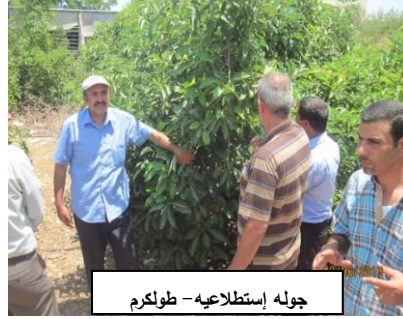
جوله استطلاعيه - طولكرم