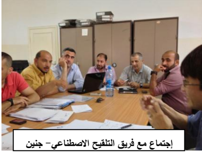
اجتماع مع فريق التلقيح الاصطناعي - جنين