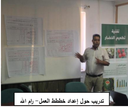
تدريب حول إعداد خطط العمل - رام الله