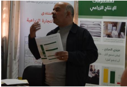
تدريب حول التسويق الزراعي- نابلس