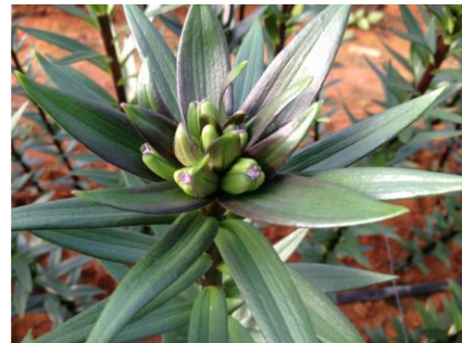
متابعة مشاهدة الزهور في قرية فروش بيت دجن