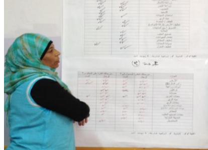
إحدى النساء المشاركات في التدريب- الجفتك