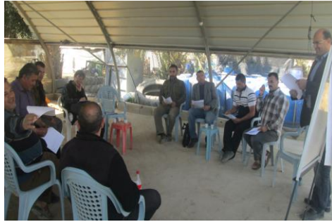
اجتماع لوضع آلية استخدام معدات السيلاج - الجفتك