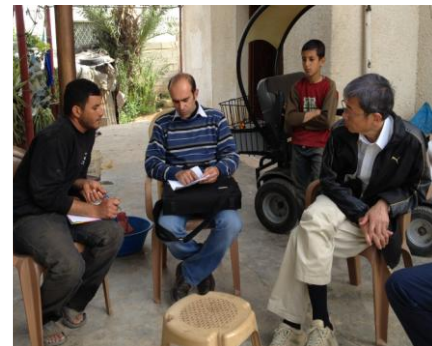
متابعة أنشطة ومشاهدات السيلاج - منطقة العقريانيه