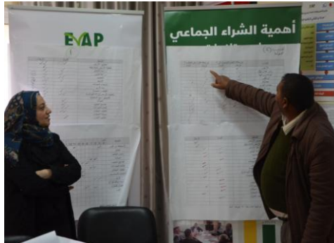
تدريب حول التسويق الزراعي- النواحي

تم عقد ورشة عمل تدريبية للمزارعين في "نابلس" بتاريخ 2014-2-27 من قبل مهندسين زراعيين تم تدريبهم مسبقا وذلك بحضور 20 مزارع 10 من الذكور و 10 من الإناث ، حيث تناولت الورشة المذكورة أعلاه عدة مواضيع تدريبية هامة منها : تدريب حول توعية المشاركين بالنوع الاجتماعي وطرح بعض التقنيات التي من دورها تقلل من الأعباء الملقاة على المرأة الريفية ، وعمل دراسة لموازنة المحاصيل التي تزرع في المنطقة والتركيز على أهمية التسويق الزراعي الذي يسبق منتدى شركاء الأعمال الزراعي، المنوى عقده الشهر المقبل.